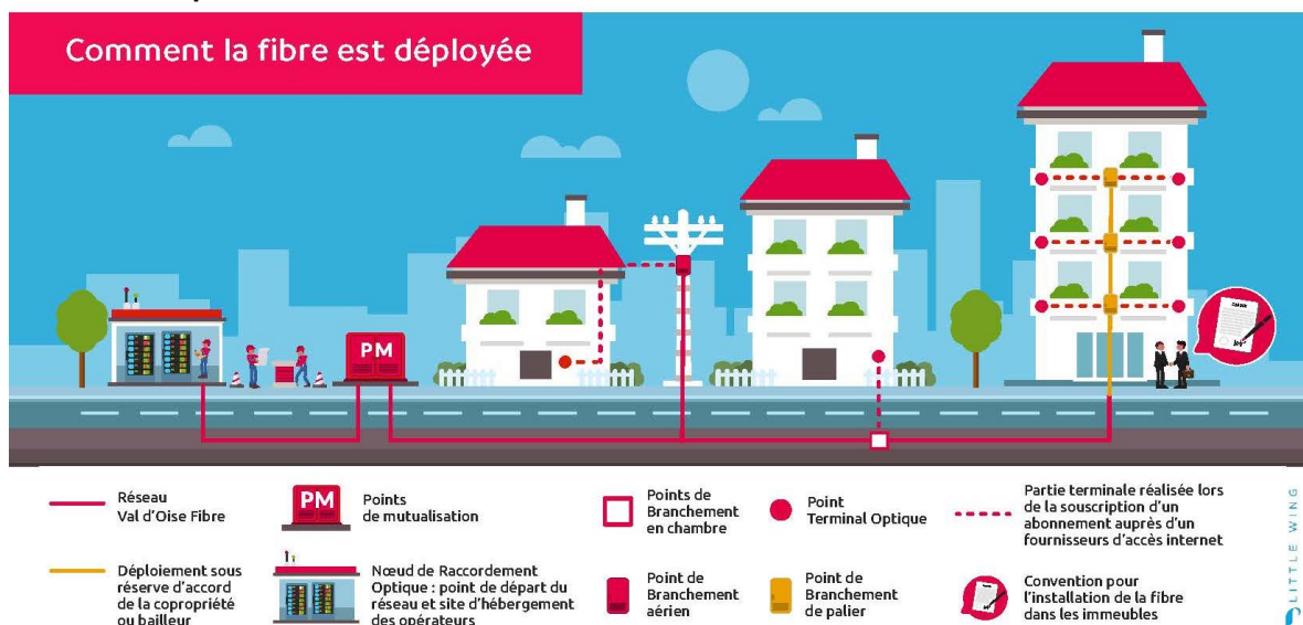
Schéma de déploiement de la fibre :

* Communes desservies par le NRO de Beaumont-sur-Oise sont : Beaumont-sur-Oise, Bernes-sur-Oise, Bruyère-sur-Oise, Champagne-sur-Oise, L'Isle Adam, Mours, Nointel, Noisy-sur-Oise, Parmain, Persan, Presles, Ronquerolles, Valmondois.